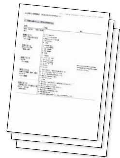
▲権利者意向調査(案)